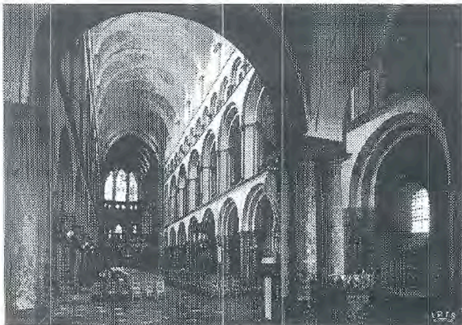
La nef de la cathédrale de Tournai, joyau de l'architecture romane de nos régions.