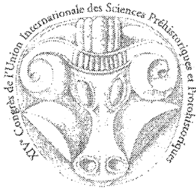
La tête de taureau du torque celtique en or de Frasnes-les-Buissenal, Hainaut (Metropolitan Museum de New York).

L'Union internationale des Sciences pré-et protohistoriques (U.I.S.P.P.), organisme rattaché à l'UNESCO, tiendra son XIVème Congrès à Liège en 2001, du 2 au 8 septembre.