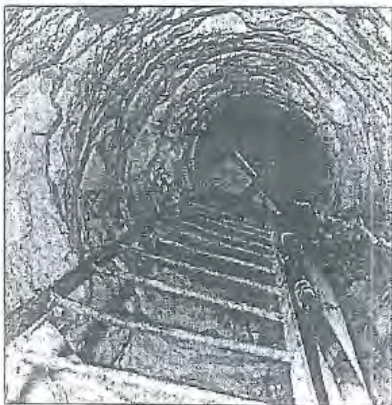
Spiennes : Camp-à-Cayaux, puît d'extraction (-16 m)

Spiennes, catacombes industrielles perdues dans un passé de six millénaires, contient