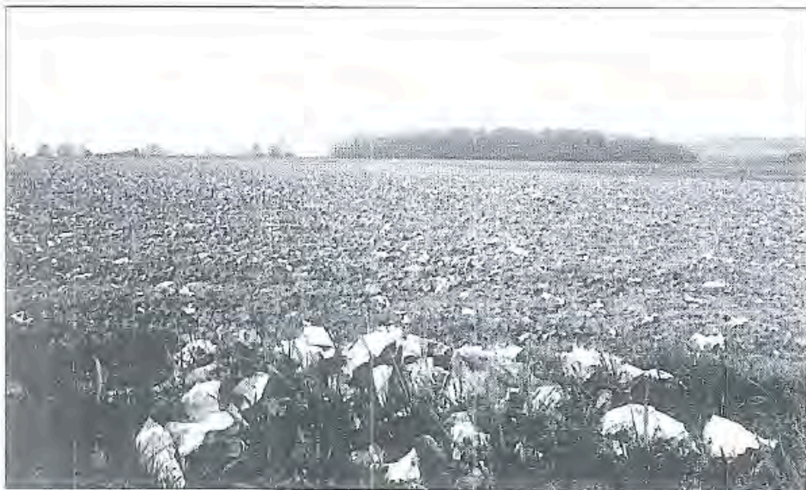
Spiennes : Camp-à-Cayaux, déchets de taille